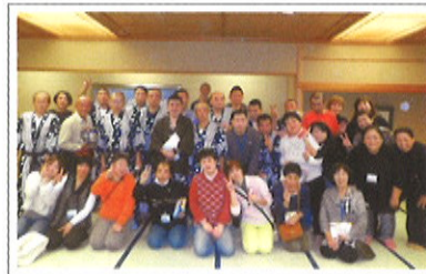
グループホーム 忘年会 2012.12.2-3 (於 宇奈月温泉)