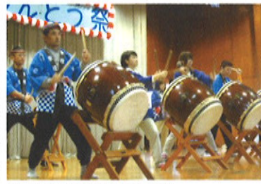
オープニングの喜楽太鼓