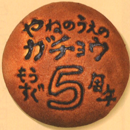
メッセージ入りデカメロン (240円)

2011年末より、既にその大きさと食感で人気商品だった「デカメロン」にお客様の希望するメッセージを描き込むサービスを開始。年明けより北日