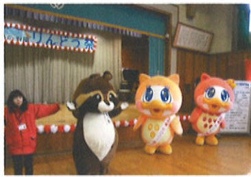
県内のゆるキャラにめひロー、めひなが仲間入り！

2012年度のりんどう祭は、めひの野園設立30周年という節目の年を迎えたこともあり、例年以上にスケールアップしたものになりました。 「いろいろな人からもらった真心にありがとう」をテーマに、来場された皆様に楽しんでいただきたいと、多くのお楽しみ企画を用意しました。 まず、アトラクションの目玉は、何といつても「ウルトラセブン」。遙か彼方の星からめひの野園まで、ちゃんと人間サイズになってやって来てくれました。また、「ご当地ゆるキャラ大集合」と題して、「ムズムズくん」「きときとくん」「里ノ助」という富山県を代表するゆるキャラが大集合しました。めひの野園のマスコットキャラクター「めひロー」「めひな」も参加し、とても賑やかになりました。 そして、富山のよさこいチーム「風神」のみなさんの元気あふれる演舞で、会場の熱気は最高潮。あいにくの天候となったりりんどう祭でしたが、そんなことを吹き飛ばすほどの大盛況でした。 ご協力いただいた地域の皆様、関係者の方々、ありがとうございました！