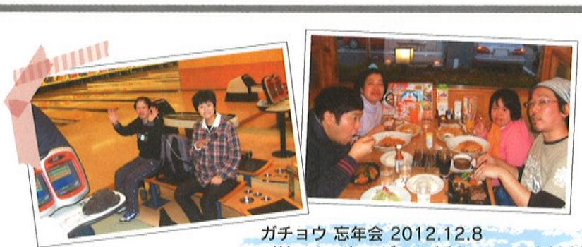
ガチョウ 忘年会 2012.12.8 (於 クアトロブーム小杉・ココス小杉店)