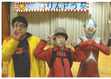
ウルトラセブンと記念撮影！