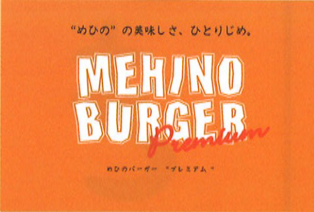
めひのバーガー プレミアム (450円)