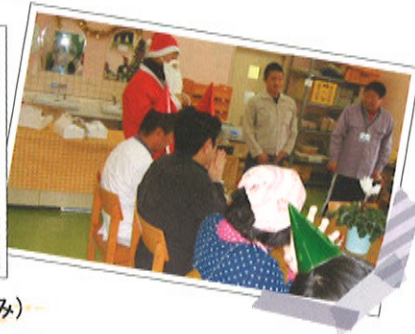
やぶなみ クリスマス会 2012.12.21 (於 やぶなみ)