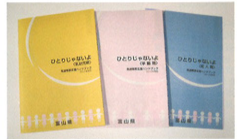
乳幼児期・学齢期・成人期のそれぞれの年代に応じて構成されたハンドブックです。

子育てをしていると、「何度言っても、なかなか言うことを聞いてくれない」「好きなことにはとことん集中するのに、興味がないことは全くしない…。どうして?」と、ついイライラしてしまったり、子どもを怒ってしまったり、「なんだかうちの子は変わっている?」と思うことがあるかもしれません。「子育てってこんなに大変なの…!?」そんな、頑張っているお母さんに、「ひとりじゃないよ」つまり、「一人で悩まないで。みんなで応援していくよー」というメッセージが込められています。