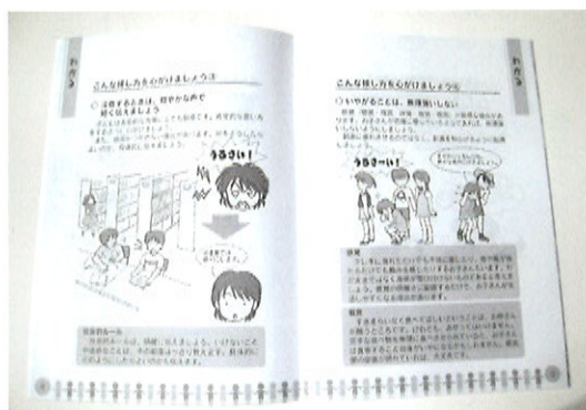
発達障害の特徴と対応について、イラストつきでわかりやすく解説されています。