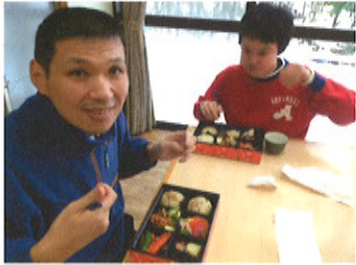
それぞれの事業所でお弁当をおいしくいただきました。