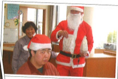
春の苑 忘年会 2012.12.20 (於 春の苑)