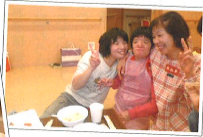
いわせのクリスマス会 2012.12.18 (於 いわせの)