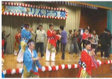
「風神」のよさこい。みんなで盛り上がりました。