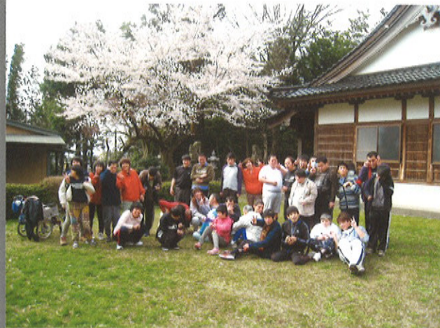
桜の前でみんなでポーズ!

春の苑のみなさんでお花見に出かけました。向かった先は近所の花の木神社。みんなで桜並木を見ながら歩いて行きました。到着後ブルーシートを広げ、ジュースと、やねのうえのガチョウのクッキーをいただきました。桜の下で食べるおやつは普段の何倍も美味しかったです。あつという間の楽しいひと時でした!