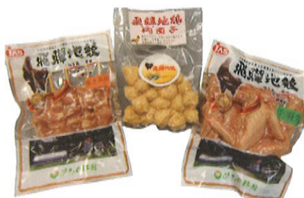
飛騨地鶏商品各種(モモ、肉団子、手羽先、焼き鳥串など)は、「フレンドリーショップ希望」、めひの野園HPで購入できます。