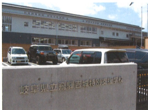
今年4月に開校した「岐阜県立飛騨吉城特別支援学校」

飛騨地鶏の生産から販売に至るまでは、多種多様な仕事があり、障害の程度に関わらず、誰でも何かしら仕事に取り組むことができます。