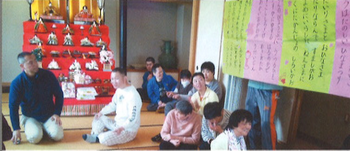
大きく書かれた歌詞を見ながら「ひな祭り」を歌いました。

今年は職員の楽器演奏による春の歌を鑑賞し、みんなで「ひな祭り」を合唱しました。そのあとはお抹茶と和菓子を頂き、のんびりとした時間を過ごしました。