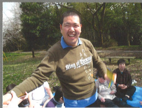
きれいな桜を見て、気持ちも晴ればれ!