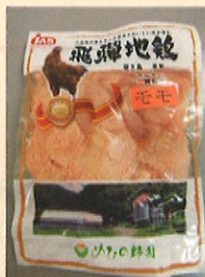
2012年度にJAS規格を取得した「飛騨地鶏」。

2012年8月、晴れて「地鶏肉特定JAS規格」を取得。飛騨地鶏も正真正銘の地鶏の仲間入りを果たすことが出来ました。