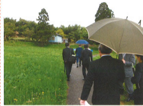
ふじなみで仕込み作業と培養室を見られた後、発生ハウスへ移動。あいにくの天候で、傘をさしての移動になりました。

鶏卵・堆肥部門の鶏舎では、約3,000羽の鶏が育ち、一日に約1,700個の鶏卵が生産されています。「平飼い」といって、鶏たちが伸び伸びと自由に運動できる鶏舎で、雄鶏と雌鶏が一緒に育ち、できるだけ自然に近い状態で飼育されている様子をご覧いただきました。