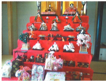
きれいに並んだひな人形