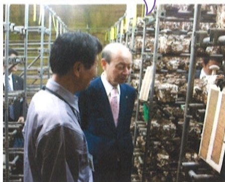
栽培ハウスに並べられた菌床ブロックから発生したしいたけをご覧になる知事。