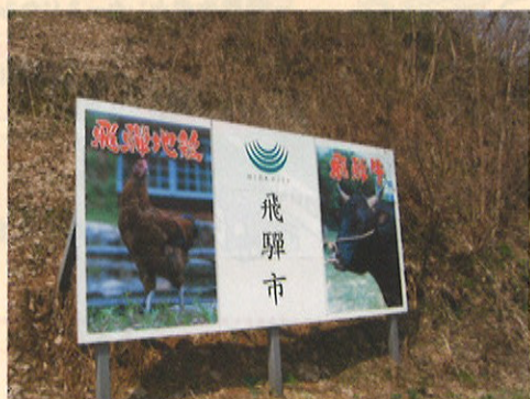
飛騨市の看板には、「飛騨牛」と並んで「飛騨地鶏」が! 全国的に認知される日も近い?

この生産数を実現するため、貯卵庫、孵卵機、育雛器を整備しました。また、法人内に営業・販売課も組織され、いよいよ販売態勢および生産態勢が整いました。