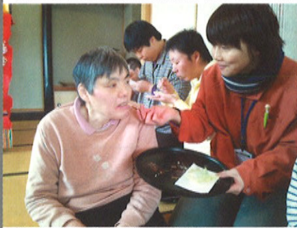
和菓子を食べて、ひな祭り気分。