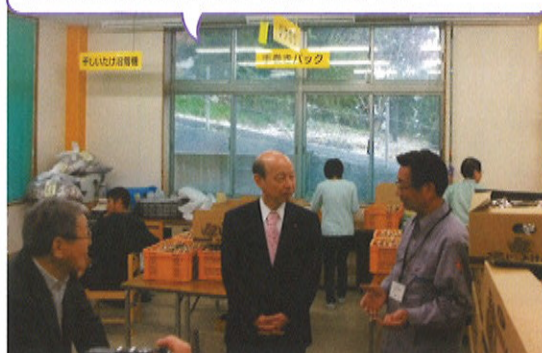
パックセンターを視察される知事。説明は野上所長。