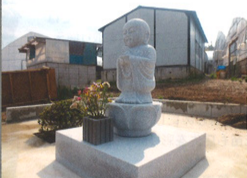
養鶏ハウスの隣で温かく見守ってくださっています。

ウオーム・ワークやぶなみ「鶏卵・堆肥部門」の鶏の供養のため、お地蔵様が建立され、地蔵祭りが行われました。「鶏の供養のために地蔵を建立しました。みなさん、この前を通る時には感謝の気持ちを込めてお地蔵さんに頭を下げて行きましょう。」と、理事長が挨拶され、住職のお経のあと、みんなで焼香しました。