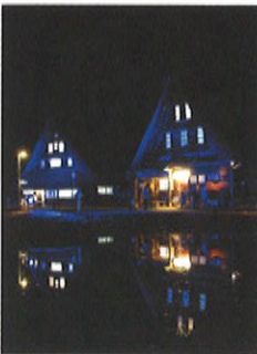
ブルーライトアップされた菅沼合掌集落

4月2日、世界各地がブルーに染まりました。 2007年12月18日、国連総会において、カタール王国王妃の提案により、毎年4月2日を「世界自閉症啓発デー」(World Autism Awareness Day)とすることが決議され、全世界の人々に自閉症を理解してもらおう取り組みが行われています。その活動の1つとして、4月2日は、各地でブルーライトアップが行われています。 ブルーと言うと、皆さんは、どのような印象がありますか？「涼しい」、「クール」、もしかすると、「冷たい」という人もいるかもしれませんが、自然界の青の代表と言ったら、「空」や「海」：生命の源でもあり、奥深い温かみをたたえていると思いませんか？童話「青い鳥」、結婚式に花嫁が青い物を身につけると幸せになるサムシングブルー、青の宝石と言えはサファイアですが、サファイアには冷静さ、明晰さとともに、 幸運をもたらすとも言われています。「世界自閉症啓発デー日本実行委員会」の公式サイトでは、ブルーは「癒しや希望」などを表す色と記されています。一見ではわからない「青」の魅力は、自閉症の方の魅力に似ているかもしれません。 今年、世界90カ国、7000カ所でブルーライトアップが行われたそうです。富山県でも富山城、世界遺産の五箇山菅沼合掌集落、小矢部市のクロスタンドタワーがブルーに染まりました。 各地の青い光を見て、「あの青い光は何？」「ああ、あれは自閉症啓発デーだよ」「えっ！自閉症って何？」と、ブルーの光が、自閉症について考えるきっかけになるのではないのでしょうか。ぜひ、皆さんも、話題にしてみてください。 たくさんの方に自閉症の魅力が伝わりますように……。 (発達障害者支援センターありそ 下田 亜由美)