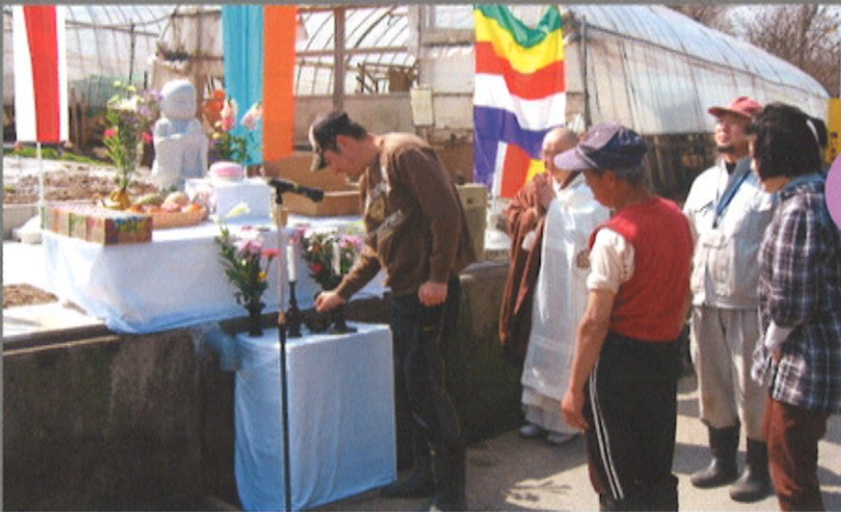
鶏卵・堆肥部門の利用者さんも焼香しました。