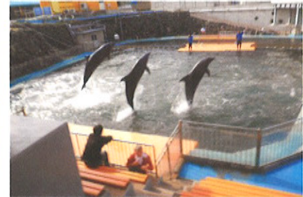
迫力のイルカのジャンプ!