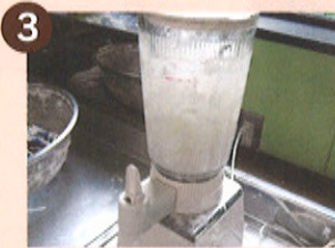
3 ミキサーにかけたものが、和紙の「具」になります。