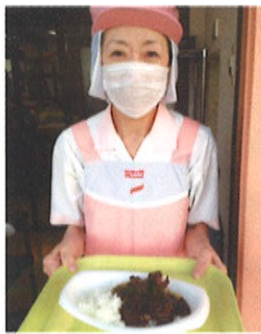
「飛騨地鶏カレー」は飛騨地鶏の旨みがたっぷり。