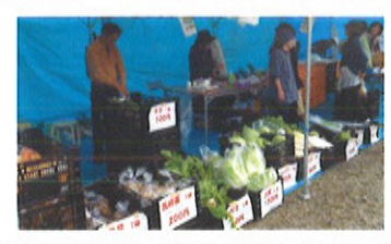
とれたての野菜、平飼いの卵、菌床しいたけがどっさり並んだテント販売。めひの野園の特産品を買うならここ！

めひの野園の特産品はいかが？ 大根や白菜などの採れたての野菜に、椎茸や、平飼いの鶏の卵、そして、近年取り組み始めた飛騨地鶏等々、りんどう祭ではめひの野園の特産品が勢揃いしました。さらに、それぞれの事業所で工夫を重ねた、めひの野園ならではの一品を味わうことができます。りんどう祭の魅力です。 今年のりんどう祭では、すでにお馴染みとなった飛騨地鶏の串焼きに加え、「わっぱ飯」、「唐揚げ」、「チゲ鍋」と、メニューが増え、厨房横では「飛騨地鶏カレー」が販売され大人気。また、椎茸のピーフシチューやホイル焼き、春の苑2階の喫茶で販売された、「やねのうえのガチョウ」のロールケーキも、りんどう祭でしか味わうことができないメニューでした。