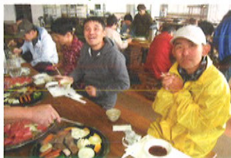
「牧歌の里」でバーベキュー