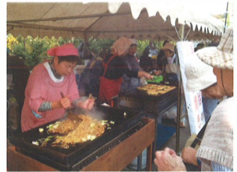
「いらっしゃいませ～！」 お好み焼きや、焼きそばといった定番メニューの模擬店では、保護者の皆さんが大活躍！元気な声で活気が溢れていました！