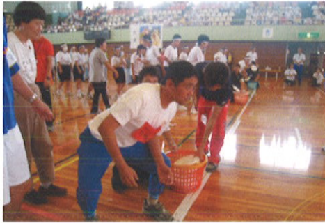
よ〜く狙いを定めて投げます!