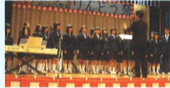
素敵な歌声が会場に響きました。呉羽高校音楽部の合唱