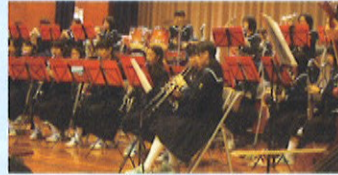
定番の曲から話題曲まで。呉羽中学校吹奏楽部の息の合った演奏