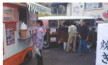
春の苑前には「愛和報恩会」の団子、「ゴストーザ」のロコモコ、「うーたんはうす」のクレープの移動販売車が並びました。どの販売車も大賑わい!