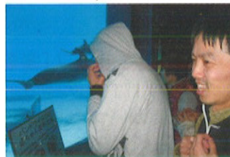
名古屋港水族館でイルカを見学

みしまの工房は岐阜・愛知方面へ旅行に行ってきました。1日目は牧歌の里でバーベキューを満喫し、金華山ロープウェイに乗り、山頂から絶景を眺めました。旅館に到着した後は長良川温泉にゆっくりと浸かり、宴会ではカラオケをして盛り上がりました。2日目は名古屋港水族館でイルカやペンギンを見て楽しみ、飛騨牛すきやきランチをおいしくいただきました。