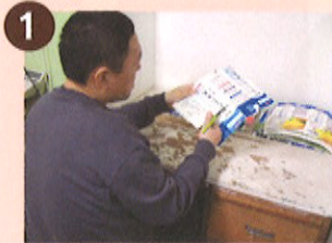
1 牛乳パックを小さく切り、鍋で煮て柔らかくします。