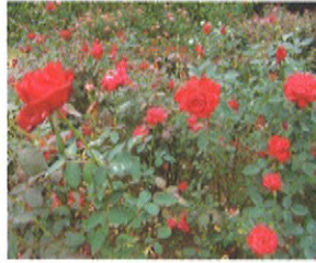
薔薇の香りに包まれた庭を優雅に散策しました。