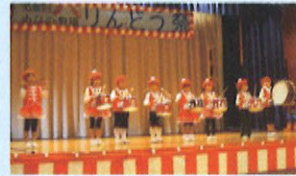
古沢保育所の鼓隊パレード。かわいらしい演技に会場が和みました。