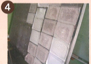
4 「具」を型で漉いて、乾燥させて和紙のできあがり。