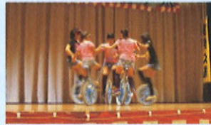
呉羽小学校の一輪車パフォーマンスは、見ている人もハラハラ!