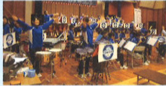
リズムカルな演奏に、思わず体が動いてしまう、富山商業高校吹奏楽部の演奏