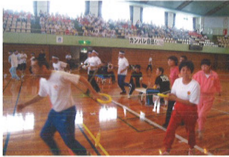
「みんな、俺について来い!」

この秋も事業所ごとに色々な場所に出掛けました。そのいくつかをご紹介します。また、「作業センターふじなみ」、「みしまの工房」の旅行では、職員こだわりの旅行日程表が作られました。どの利用者にも旅行を楽しんでもらえるよう、複数のコースを用意したり、サービスエリアのトイレの場所を詳しく示したり、おすすめのお土産を紹介したりと工夫を凝らしました。