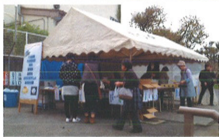
体育館横のテントでは、地域から出店していただいた商品の販売が行われました。

地域の皆様との交流の輪が深まることを願って毎年開催している「りんどう祭」。31回目を迎える今年のテーマは、「出会いと創造」新たな一步を地域と共に」とし、様々なステージ企画や、めひの野園ならではのメニューが多数用意されました。 また、地元地域の商店からの出店や、移動販売車での販売もあり、今年のりんどう祭は大変賑わいました。多くの皆様に来場していただき、熱気に包まれた今年のりんどう祭をレポートします！