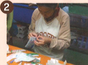
2 表面のビニールをはがし、細かくちぎります。