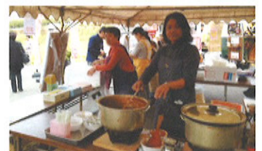
作業センターふじなみの「椎茸たっぷりビーフシチュー」が食べられるのは、りんどう祭だけ!