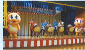
めみロー、めひなも登場した喜楽太鼓の和太鼓演奏