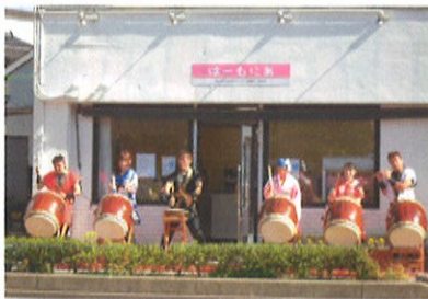
オープニングセレモニーでの「喜楽太鼓」の演奏