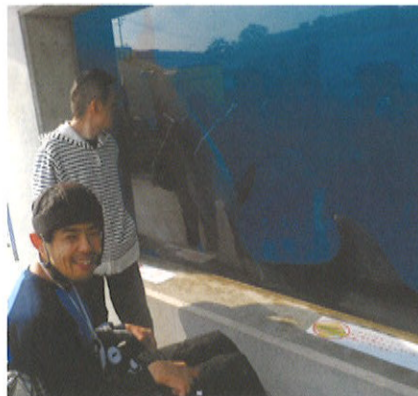
水槽の中には何がいるかな?

「グルメ三昧 加賀・越前 山代温泉の旅」と題して、プラネタリウム型映画館や、コスモアイル羽咋(宇宙科学博物館)、越前町松島水族館などでのんびりと楽しむことができました。