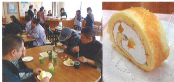
春の苑2階は喫茶コーナー。やねのうえのガチョウのロールケーキは、この日だけの限定品! また、4階ではお茶席と絵画展示、1階では利用者作品の販売が行われました。