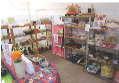
「はーもにあ」店内の様子

営業時間 AM10:00～PM7:00 定休日 月曜日・火曜日・祝日 ☎(076)422-0277