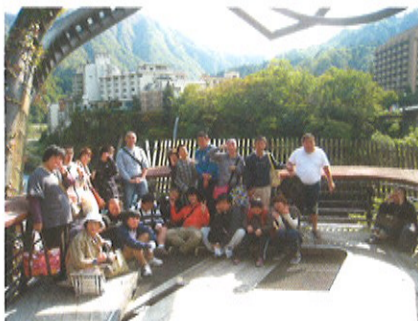
温泉街をのんびり散策しました

日帰りで宇奈月温泉に行ってきました。温泉街を散策して、足湯に浸かった後は旅館で豪華な料理と温泉を楽しみました。