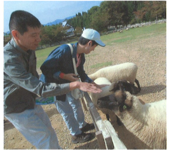
牧歌の里では、大自然に囲まれて、かわいい動物と触れ合うことが出来ました。