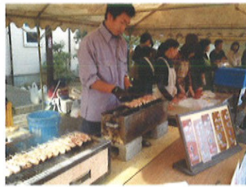
串焼きに、わっぱ飯、唐揚げ、チゲ鍋と、飛騨地鶏を使ったメニューが並びました。串焼きの香ばしい香りが食欲をそそりました。