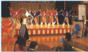
アトラクションの最後を飾った「紅組」のよさこい

（アトラクション会場（体育館）） 体育館では、今年も様々なステージ発表が行われました。