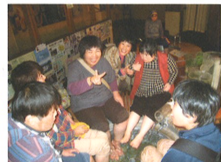
足湯に浸かってリラックス