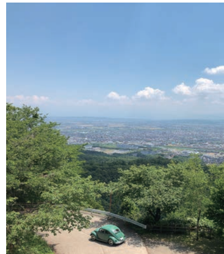
家持が赴任した伏木（高岡市）の二