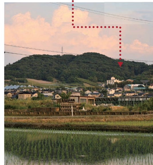
夕暮れの呉羽丘陵。矢印の先がめひの野園です。