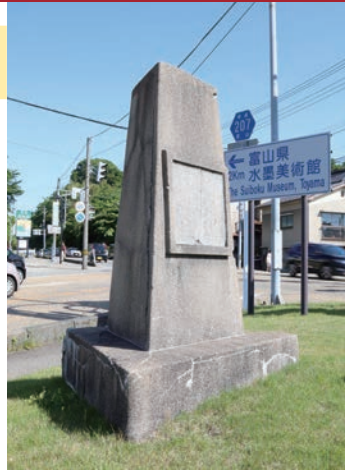
富山高岡線茶屋町交差点の「万葉歌人高市黒人歌碑」。現在はほとんど読めないほど風化が進んでいる。

高市黒人（たけちのくろひと）は、万葉集を編纂した大伴家持より40〜50年前に活躍した人物で、「旅の歌人」と称され、旅先で旅愁を漂わせる歌を多く作りました。家持がこの歌を伝え聞いた時には、すでにいつ作られたのか分からなくなっていたようです。 黒人が越中の婦負郡を通過する時に、ひどい降雪に遭遇したのだと想像されますが、なぜ婦負郡を通ったのかまでは分かりません。