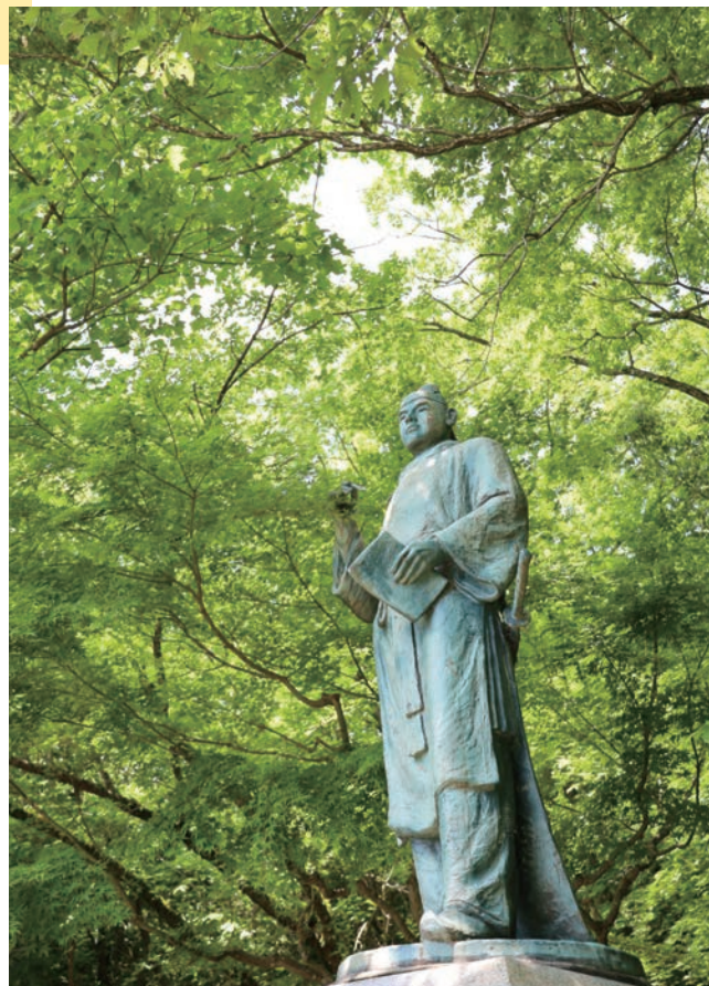
二上山頂上付近に建てられている大伴家持像。