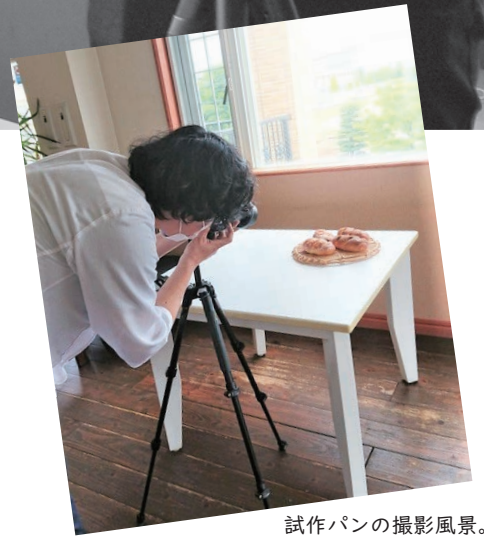
試作パンの撮影風景。

Q. 写真はどう活用していますか？ ——店頭に置くPOPや、ポスター、チラシに使ったり、雑誌に掲載されたりしています。細かな設定や技術的なことよりも、構図にこだわっています。一番伝えたいことが伝わり、パッと目を引くような構図が良いですね。パンの柔らかさを伝えるために、実際にちぎって撮ったりもしました。日頃から雑誌やSNSを見ていて、好きなイメージのものはスマホに保存し、参考にしています。