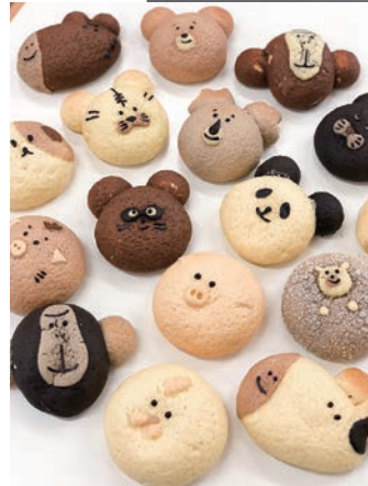
全国3位に選ばれた「動物パン」。