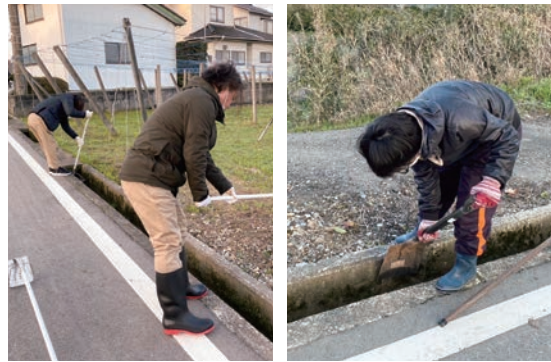
地域の皆さんと一緒に溝掃除に参加しました。