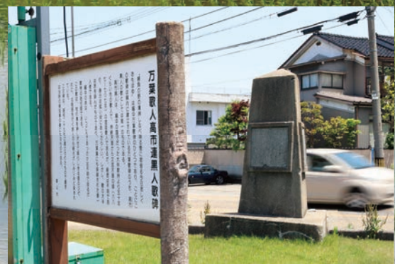
富山高岡線「茶屋町」交差点の歌碑

万葉集で「婦負の野(めひのの)」と詠われた呉羽丘陵西側斜面。宅地整備が進み、水田や、特産品である「呉羽梨」の畑が広がるこの地は、かつては薄(ススキ)が生い茂る平野であったという。